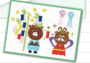
イラスト/たによん事業所 S.M.さん