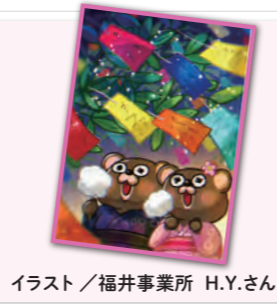
イラスト/福井事業所 H.Y.さん