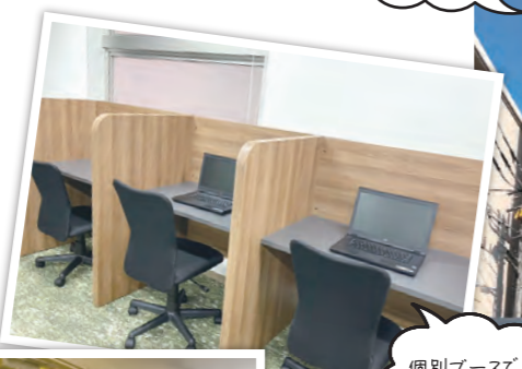
個別ブースで 集中出来ます!