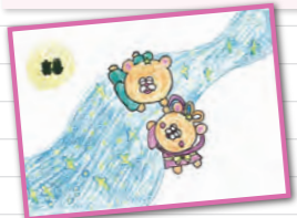
イラスト/たによん事業所 S.M.さん