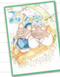
イラスト/金沢事業所 F.S.さん