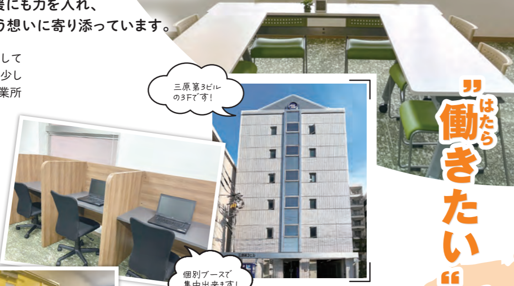
三原第3ビル の3Fです!

資格取得支援や在宅支援にも 対応し、「働く」と「学ぶ」を自分 のペースで両立できる環境を整 えています。安心して次の一 歩を踏み出せる場所を目指して います。