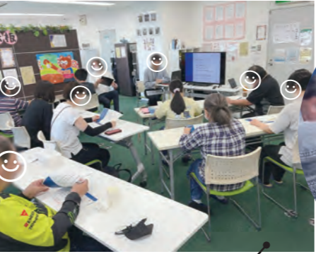
ハローワークと連携した出張説明会