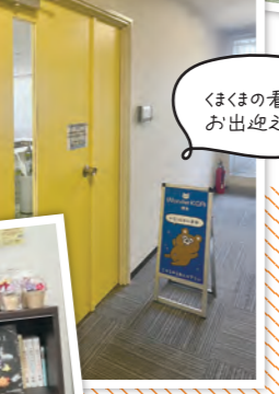
くまの看板が お出迎え♡