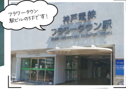
フラワータウン 駅ビルの5Fです!