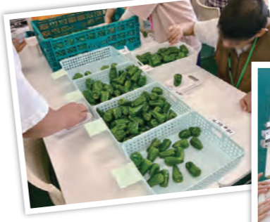
お仕事の内容も充実しています!